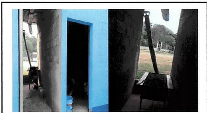
Foto 3: Mejoramiento de instalaciones de cocina y bodega para unificar un solo ambiente entre cocina y bodega.