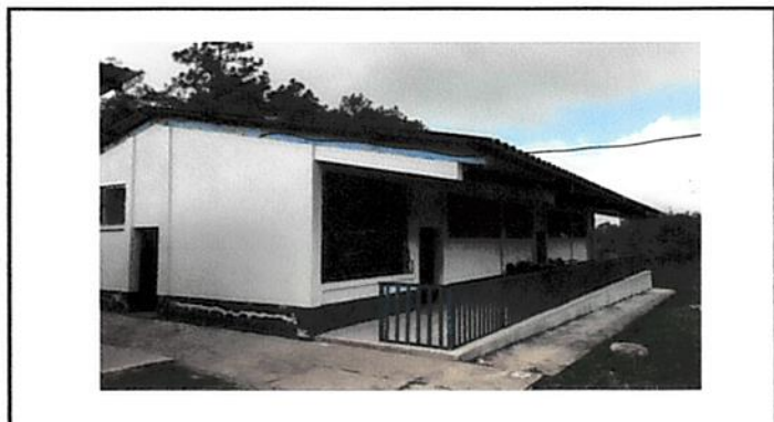
Foto 4: Pintura de exterior e interior de cocina, bodegas y aulas.