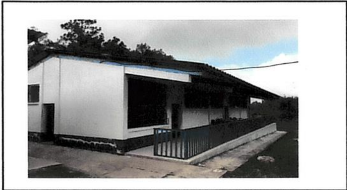
Foto1: Instalación de ventanas de PVC.