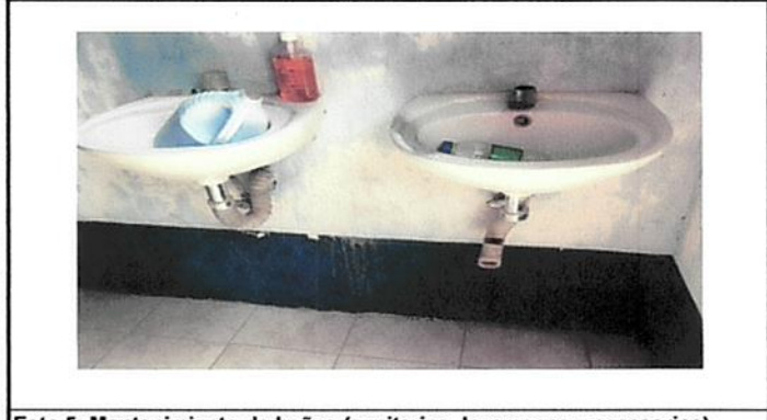
Foto 5: Mantenimiento de baños (sanitarios, lavamanos y accesorios).